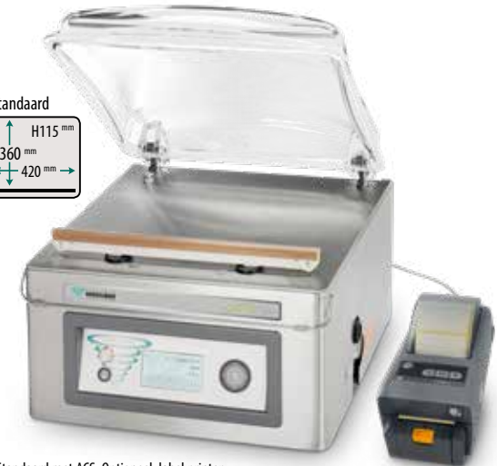
Standaard met ACS. Optioneel: label printer

POMPCAPACITEIT 16 m 3 /h MACHINECYCLUS 15-30 sec KAMERAFMETINGEN 360 x 420 x 115 mm MACHINEAFMETINGEN 530 x 490 x 395 mm SEALBALK 420 mm GEWICHT 55 kg VOLTAGE 230V-1-50Hz VERMOGEN 0,7 kW